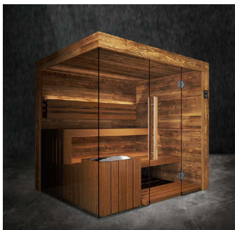
TyrolHolz & ThermoEspe