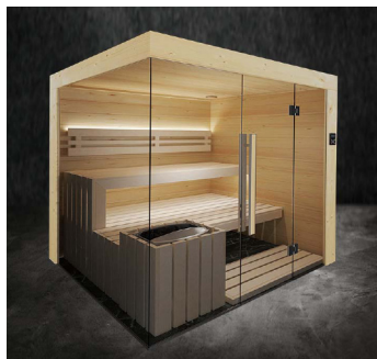
Nord, Fichte & Espe Hell