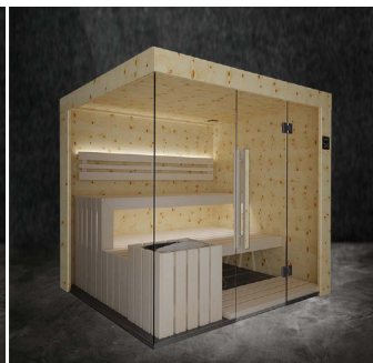
Zirbenholz & Espe Hell